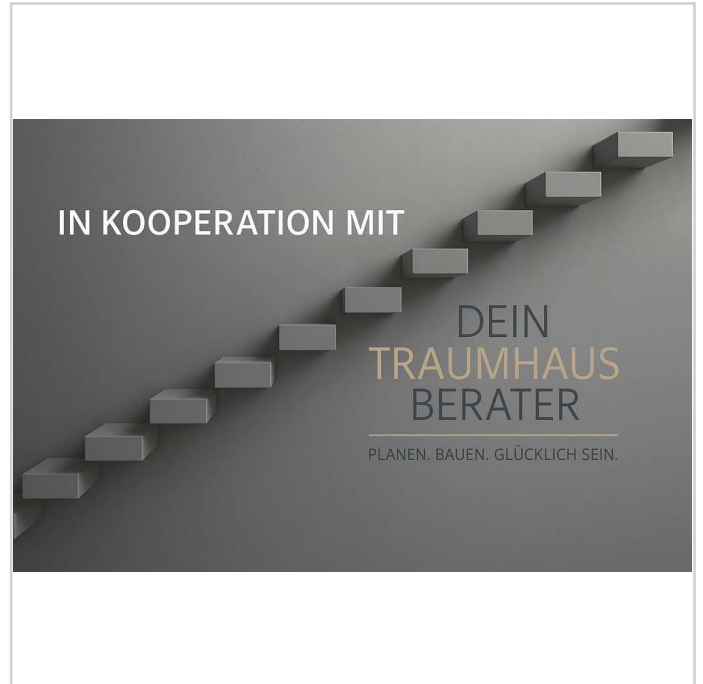
Dein Traumhaus Berater