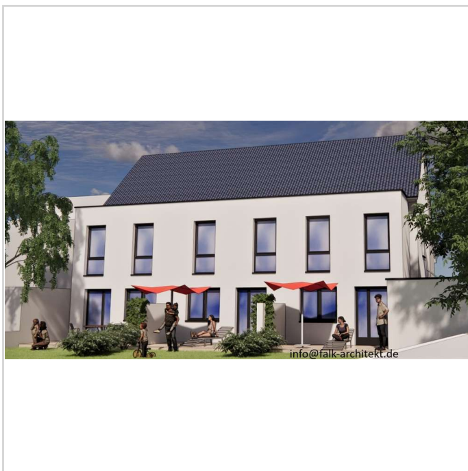
Ansicht Garten 2

Zimmer: 5,00 Wohnfläche ca.: 101,00 m 2 Kaufpreis: 588.999,00 EUR